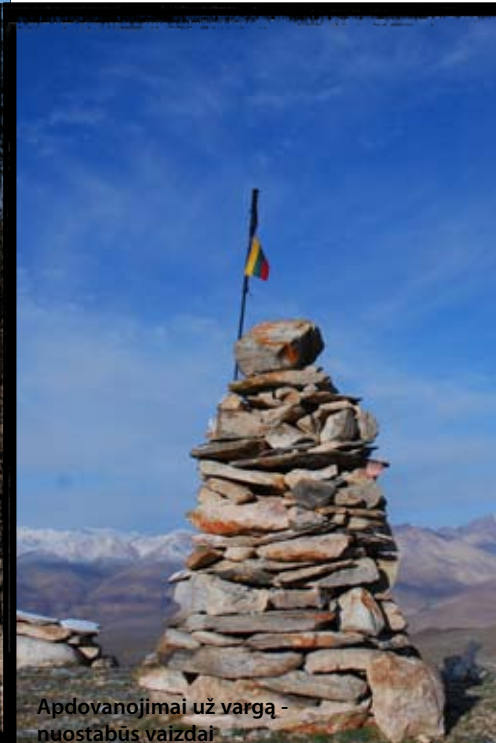
Apdovanojimai už vargą - nuostabūs vaizdai