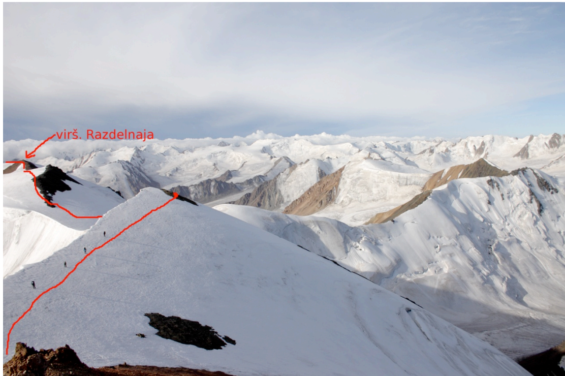
Paveikslas 4. Traversas žvelgiant nuo per. Surovyj link per. Bivačnyj pusės