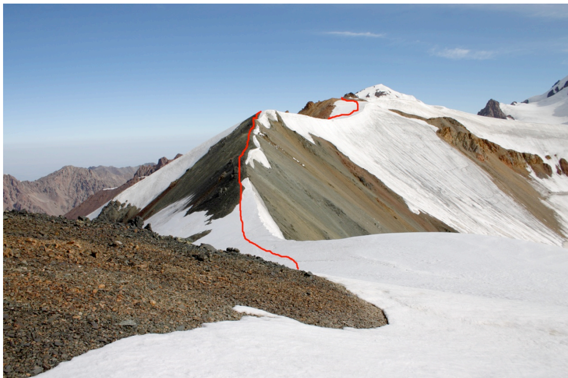
Paveikslas 5. Traversas žvelgiant nuo per. Bivačnyj link per Surovyj pusės

Pagal aprašymą per ledyną einame laikydamiesi kairės. Tačiau tai nėra geriausias variantas ir kitoms grupėms rekomenduojame eiti link ledyno centro laikantis dešinės pusės, kad apeiti staigų ledyno kritimą. Praėjimas kaire puse gana status. Pradžioje pereiname ant akmenų, nusileidžiame iki vietos kur galima užlipti ant kairėje esančio liežuvio ir tuo liežuviu leidžiamės žemyn. Prie pat vietos, kur ledynas išsilygina vėl organizuojame saugą virve, nors ši sauga nėra nebūtina, kadangi nuolydis apie 40