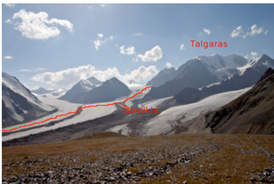
Paveikslas 1. Korženevskio ledynas nuo Kokbulak perėjos

upelio Kokbulak, bet prie jo nusileisti neapsimoka. Iš čia jau matosi perėja Kokbulak (4036,1a). Artėjant prie morenos. Taikome prie vietos, kur Kokbulak upelis, morenoje krenta kriokliuku. Peršokam upelį ir iki pat ledyno einam kairiu (ėjimo k.) jo krantu per moreną. Prienam ledyną ir jo pakraščiu einam iki moreninio ežeriuko. Čia užsidedam kates ir kylam link perėjos. Statumas apie dvidešimt laipsnių. Ledynas atviras, be plyšių. Netoli perėjos yra pora plyšių, kuriuos lengvai apeinam. Ant Kokbulak perėjos (GPS: 4306.444, 07725.396, 4049m) labai gražu. Matosi Talgaras ir Korženevskio ledynas. Leistis nuo perėjos itin lengva. Pirmą kalniuką apeinam iš dešinės, o vėliau laikomės kairės. Čia leidžiamės palei upelį. Tolumoje matosi išmeigtas metalinis stulpas (sniego lygiui stebėti). Einame tiesiai link jo. Už jo leidžiamės kairiau iki gražios vietos vadinamos Rojaus pievele, kurioje lengvai galima pastatyti kelias palapines ir yra mažas švaraus vandens upelis (GPS: 4305.636, 07724.602, 3704m).