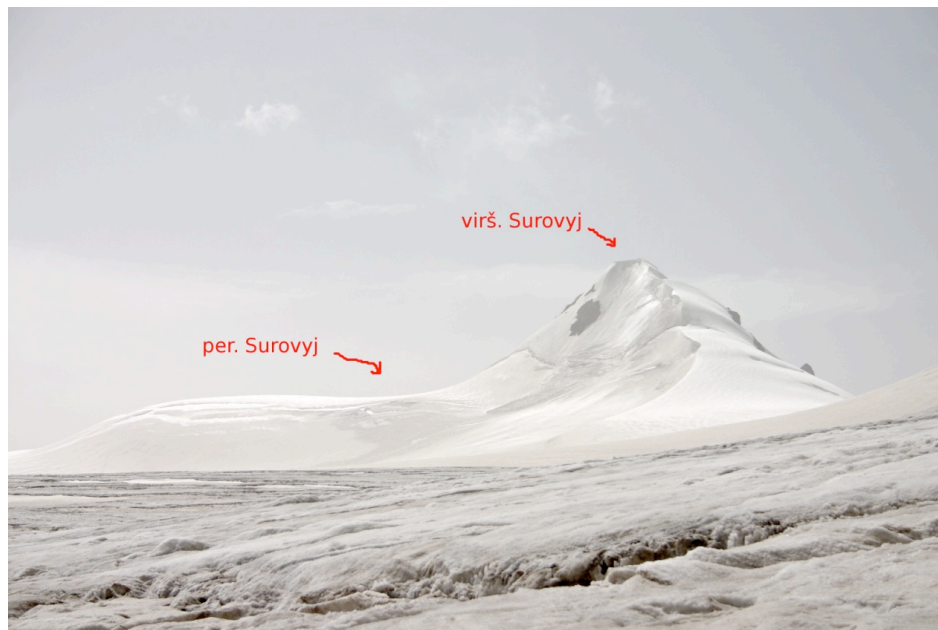
Paveikslas 3. Perėja Surovyj nuo Korženevskio ledyno

Statomės palapines netoli traverso pradžios ant uždaro ledyno be plyšių (GPS: 4304.994, 07718.859, 4479m). Čia prisiminę vakarykštę naktį statomės sieneles nuo vėjo. Tai užtrunka apie porą valandų, tačiau naktis praeina labai ramiai.