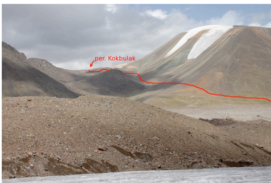
Paveikslas 2. Kokbulak perėja nuo Korženevskio ledyno